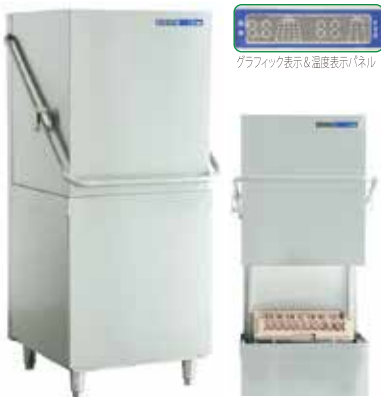
グラフィック表示&温度表示パネル