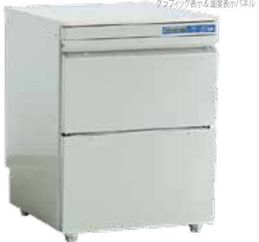
グラフィック表示&温度表示パネル