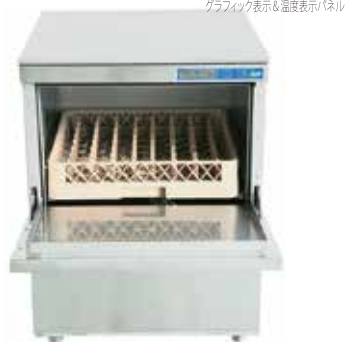
グラフィック表示&温度表示パネル